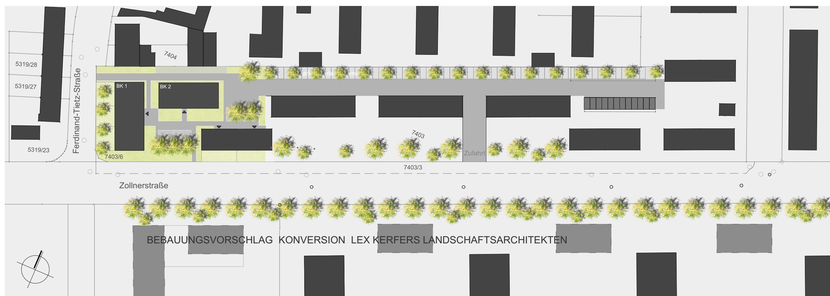
BAUABSCHNITT 1 - Umsetzung des Bebauungsplans Nr.408