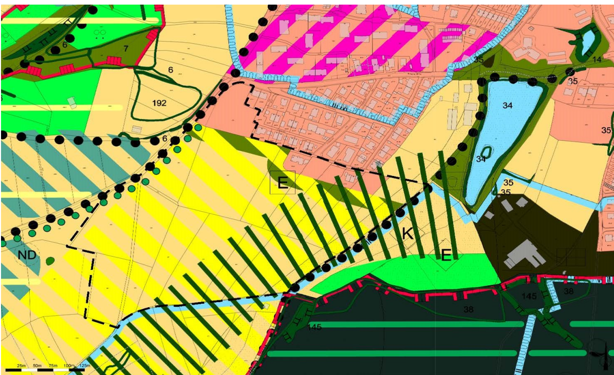
Abbildung 3: Teilplan LP zum FNP der Stadt Bamberg vom 06. Dezember 1996 (letzte Änderung März 2018)