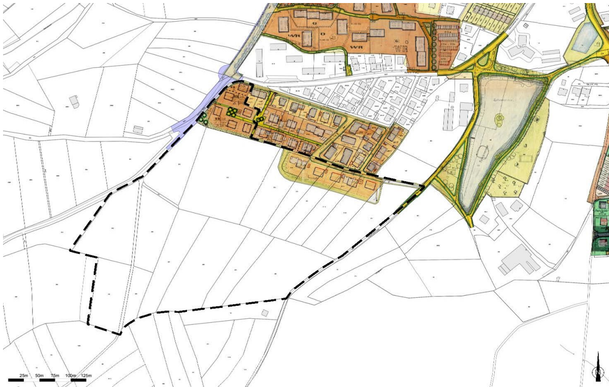
Abbildung 4: Rechtskräftige Bebauungspläne Nr. G 13 A und G 13 B