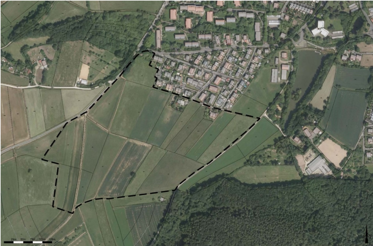
Abbildung 1: Geltungsbereich des Rahmenplans „Jungkreut“

Soziale Infrastruktur ist unmittelbar in Form von Kindergärten (Katholischer Kindergarten St. Sebastian; Waldorfkindergarten, Katholischer Kindergarten St. Josef), der Grund- und Mittelschule Gaustadt und der Kirchengemeinde St. Josef zu finden. Ein zusätzlicher Bedarf an sozialer Infrastruktur ist im weiteren Verfahren näher zu untersuchen. Ebenfalls in der Nähe liegen diverse Freizeitmöglichkeiten, wie z.B. das Freibad und der Michelsberger Wald.