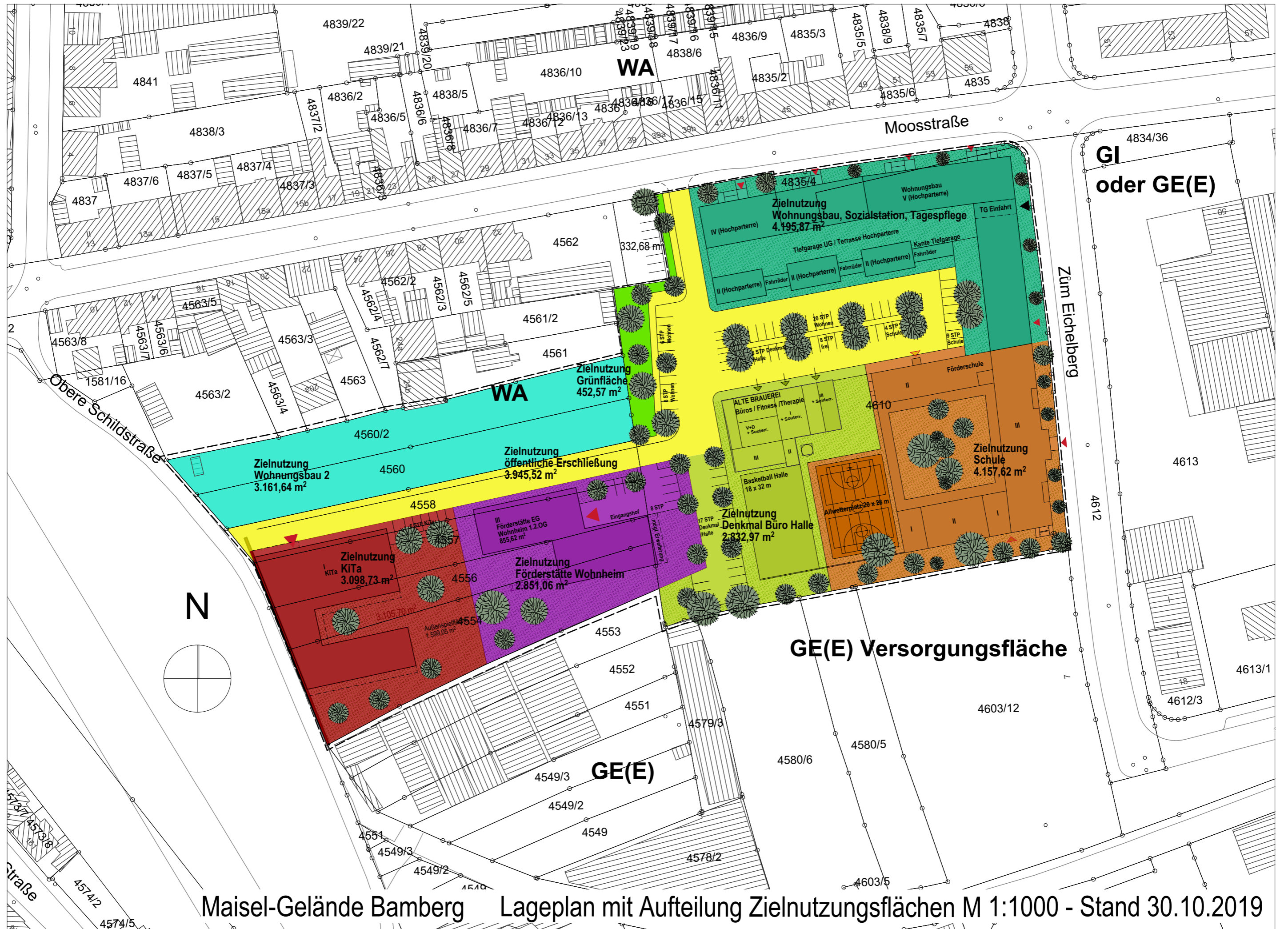
Maisel-Gelände Bamberg Lageplan mit Aufteilung Zielnutzungsflächen M 1:1000 - Stand 30.10.2019