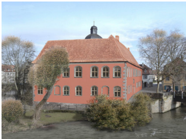
Fotomontage (Sichtfassung / 1960er)