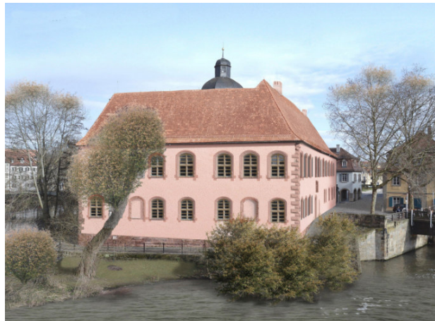
Fotomontage (Ende 18.Jh.)