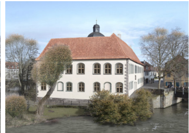
Fotomontage (Mitte 18.Jh.)