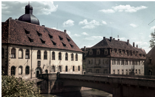
Fotografie Anfang 20. Jh.