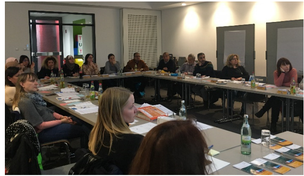
Abbildung 3: Schulung Bayerisches Bildungssystem