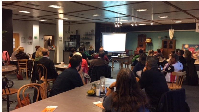
Abbildung 1: Kick-Off-Veranstaltung "Eltern-Verstehen-Schule"

Mit der Förderzusage der Adalbert-Raps-Stiftung wurde ein Planungsteam „Eltern-Verstehen-Schule“ bestehend aus der Koordinatorin und den Kooperationspartnern des Pilotprojektes (Amt für Inklusion und Migranten- und Integrationsbeirat der Stadt Bamberg), sowie einer Ansprechpartnerin aus dem Landkreis Bamberg gegründet. Gemeinsam mit einem externen Layouter wurde ein Logo zum Projekt, Flyer und Poster entworfen, sowie parallel das Schulungskonzept gemeinsam mit dem neuen Kooperationspartner „Brückenbauen – Kulturmoderation“ finalisiert, sodass im Oktober zu einer gut besuchten Kick-Off-Veranstaltung für alle Interessierte (v.a. potentielle Bildungslotsen und Schulleitungen der Pilot-Grundschulen) eingeladen werden konnte.