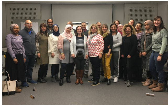
Abbildung 4: Gruppenbild mit "Brückenbauen-Kulturmoderation"

Am 07.03.2020 ist eine Zertifikatsübergabe über die Erfolgreiche Qualifizierung im Rahmen von Eltern-Verstehen-Schule durch den 2. Bürgermeister der Stadt Bamberg und dem Landrat des Landkreises Bamberg geplant.