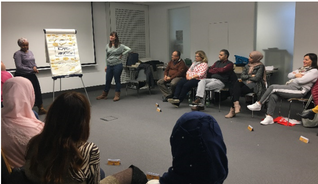
Abbildung 2: Schulung kultursensible Kommunikation

Ziel der Veranstaltungen war die Vorbereitung der Teilnehmer*innen auf die Tätigkeit als Bildungslots*innen, vor allem im Hinblick auf die Unterstützung bei Elterngesprächen.