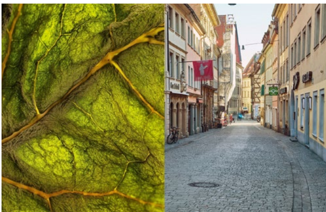
Foto Doppelbild: Gimes Blatt © Bernd Seydel und Thomas Wolf, obere Sandstraße © Jürgen Schraudner

ist im Jahr 2020 höchst aktuell, aktueller als man es für möglich gehalten hätte. Thomas Wolf, Bernd Seydel (beide Gotha) und