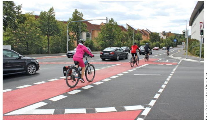
An der Einmündung Regensburger Ring / Anna-Maria-Junius-Straße / Weidendamm wurde ein verkehrssicherer Knotenpunkt geschaffen.

Ziel des Gesamtprojektes ist es, eine schlüssige und sichere Radverkehrsanlage zu schaffen, die Knotenpunkte und Bushaltestellen barrierefrei zu gestalten und die Straßenoberflächen zu sanieren. Nach Ausbau der Knotenpunkte Margaretendamm/Magazinstraße 2016 und Sie-