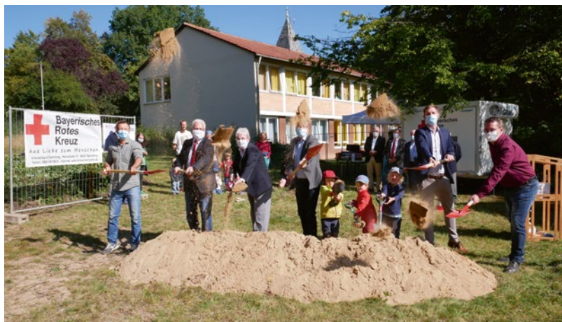
Spatenstich an der Wildensorger Schule für den neuen BRK-Kindergarten.

Die Erweiterung des Bauernhofkindertages wurde im Gegensatz zum bereits bestehenden als konventioneller Kindergarten konzipiert, d.h. die