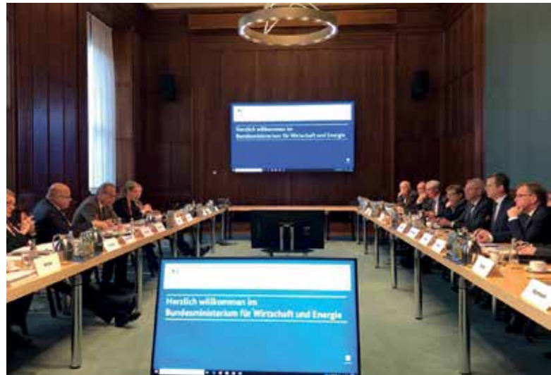
Die „Bamberger Runde“ mit Wirtschaftsminister Peter Altmaier (z.v.l.)

vertiefen. Bis dahin sind die Ansprechpartner zu definieren, die Verantwortlichen der Automobilzulieferer zu beteiligen und die kommunalen Projekte (zum Beispiel Lagarde-Kaserne, Energiekonzepte etc.) zu konkretisieren.