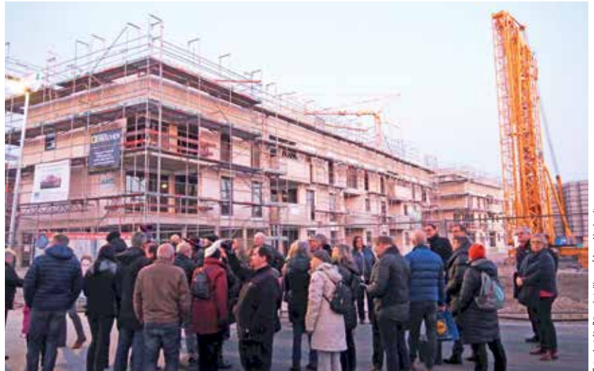
Die Wohnbebauung im Ulanenpark sorgte für reges Interesse bei den Bürgerinnen und Bürgern.