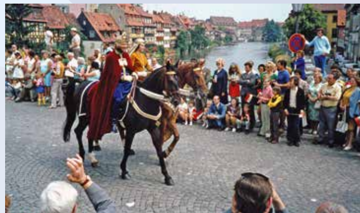
Festzug zur 1000-Jahr-Feier der Stadt Bamberg 1973: Heinrich II. und Kunigunde reiten über die Markusbrücke.

17.2.2020, 19 Uhr, Großer Saal, Altes E-Werk, Tränkgasse 4