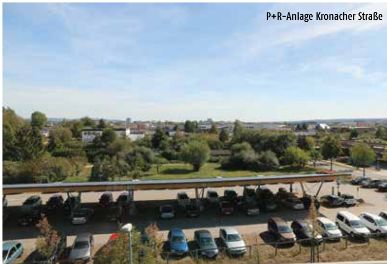
P+R-Anlage Kronacher Straße

Die Initiative war von OB Starke angestoßen worden, nachdem die Stadtwerke mit dem kostenlosen Busfahren im Advent durchweg positiven Erfahrungen gemacht hatten. Die neue Idee hat parteiübergreifend große Zustimmung gefunden. Mit der verkehrspolitischen Reform sollen die Pkw-Fahrer gezielt auf die beiden Parkplätze gelotst und mit den P+R-Bussen komfortabel und gratis bis zum Zentralen Omnibus Bahnhof (ZOB) transportiert werden. Die Stadtwerke lassen sich das Angebot jährlich 480.000 Euro kosten, die durch Einsparungen an anderen Stellen gegenfinan-