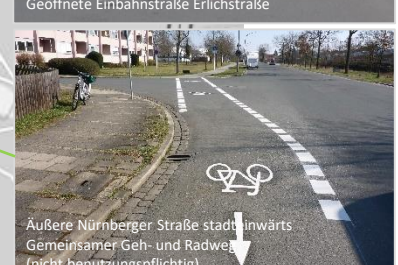
Außere Nürnberger Straße stadteinwärts Gemeinsamer Geh- und Radweg (nicht benutzungspflichtig)