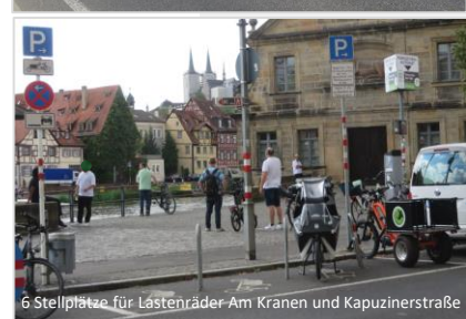
6 Stellplätze für Lastenräder Am Kranen und Kapuzinerstraße