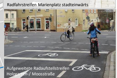
Aufgeweitete Radaufstellstreifen Holzgärtchen-/ Moosstraße