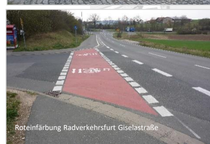
Roteinfärbung Radverkehrsfurt Giselstraße