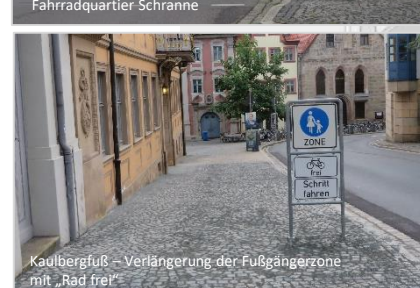
Kaulbergfuß - Verlängerung der Fußgängerzone mit „Rad frei“