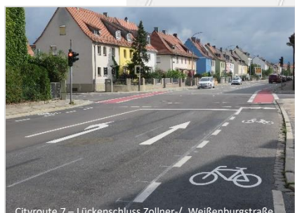
Cityroute 7 – Lückenschluss Zollner-/ Weibenburgstraße