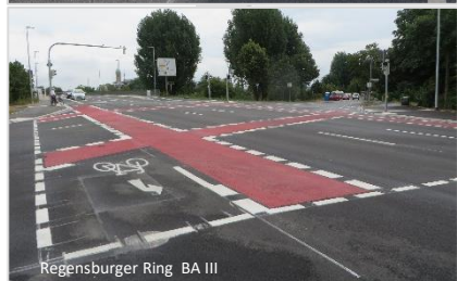
Regensburger Ring BA III