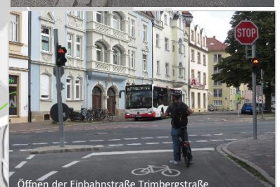
Öffnen der Einbahnstraße Trimbergstraße