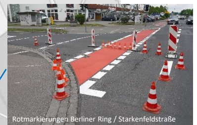
Rotmarkierungen Berliner Ring / Starkenfeldstraße