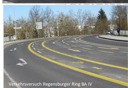
Verkehrsversuch Regensburger Ring BA IV