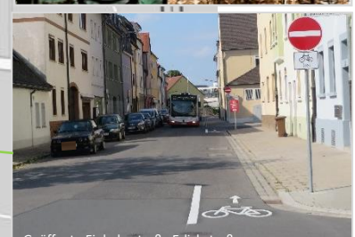
Geöffnete Einbahnstraße Erlichstraße