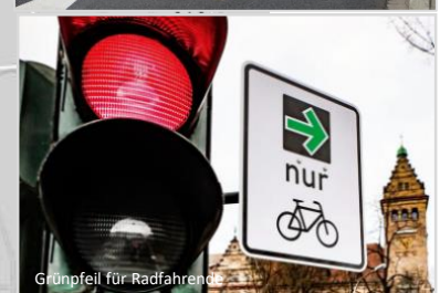
Grünfeld für Radfahrer