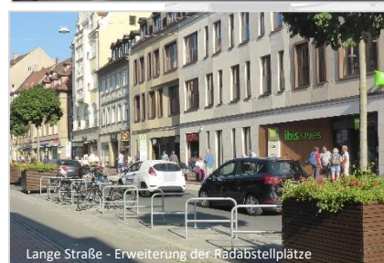
Lange Straße - Erweiterung der Radabstellplätze