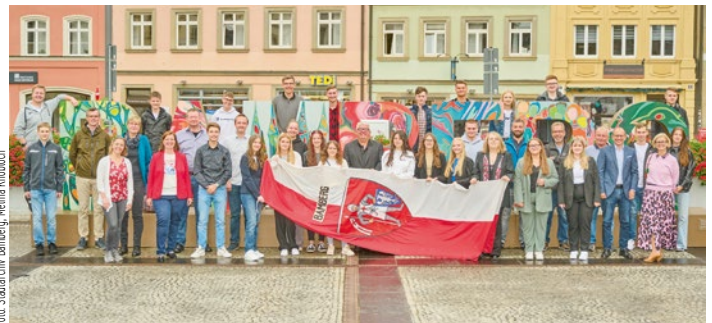
Die neuen Azubis freuen sich mit ihren Ansprechpartner:innen aus der Stadt Bamberg auf den Start ins Berufsleben.

Im Anschluss führte Dritter Bürgermeister Wolfgang Metzner durch das Rathaus.