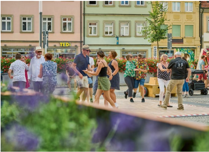
Hochbeete, Tanzboden und Fotopoint bleiben noch eine Weile am Maxplatz.