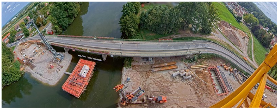
Webcam-Blick auf den Neubau der Buger Brücke am 18. September 2023.

Mit dem Kranaufbau und dem Beginn der Gründungsarbeiten für den Flusspfeiler mittels eines Großbohrgerätes ist das Projekt in diesen Tagen gewissermaßen in die heiße Phase des eigentlichen Brückenbaus eingetreten. Daher ist der Blick auf das Baustellengeschehen im