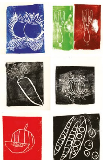
Diese Kunstwerke entstanden bei dem Projekt.