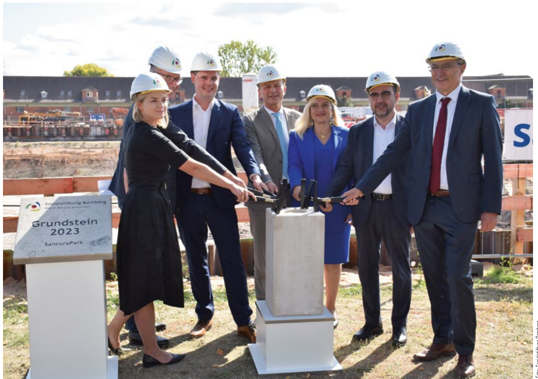
Der Grundstein für den SancuraPark mit Medical Valley Center ist gelegt.

Das Medical Valley Center Bamberg im SancuraPark ist ein absoluter Gewinn für die Zukunftsausrichtung des Wirtschaftsstandortes Bamberg. Auf über 3.000 m 2 finden innovative Unternehmen der wachstumsstarken Gesundheitswirtschaft eine gemeinsame Heimat sowie eine Topadresse in bester Lage. Der SancuraPark wird sicherlich noch weitere attraktive Unternehmen aus der Branche anziehen, da dort in vorbildhafter Weise eine zukunftsorientierte Pflege mit modernster Technik kombiniert werden soll. Die Innovationen der Unternehmen aus dem Medical Valley Center Bamberg können so direkt in die Pflege integriert und auf ihre Umsetzbarkeit überprüft werden. Mein Dank gilt der Sozialstiftung Bamberg als künftige Betreiberin des SancuraParks und insbe-