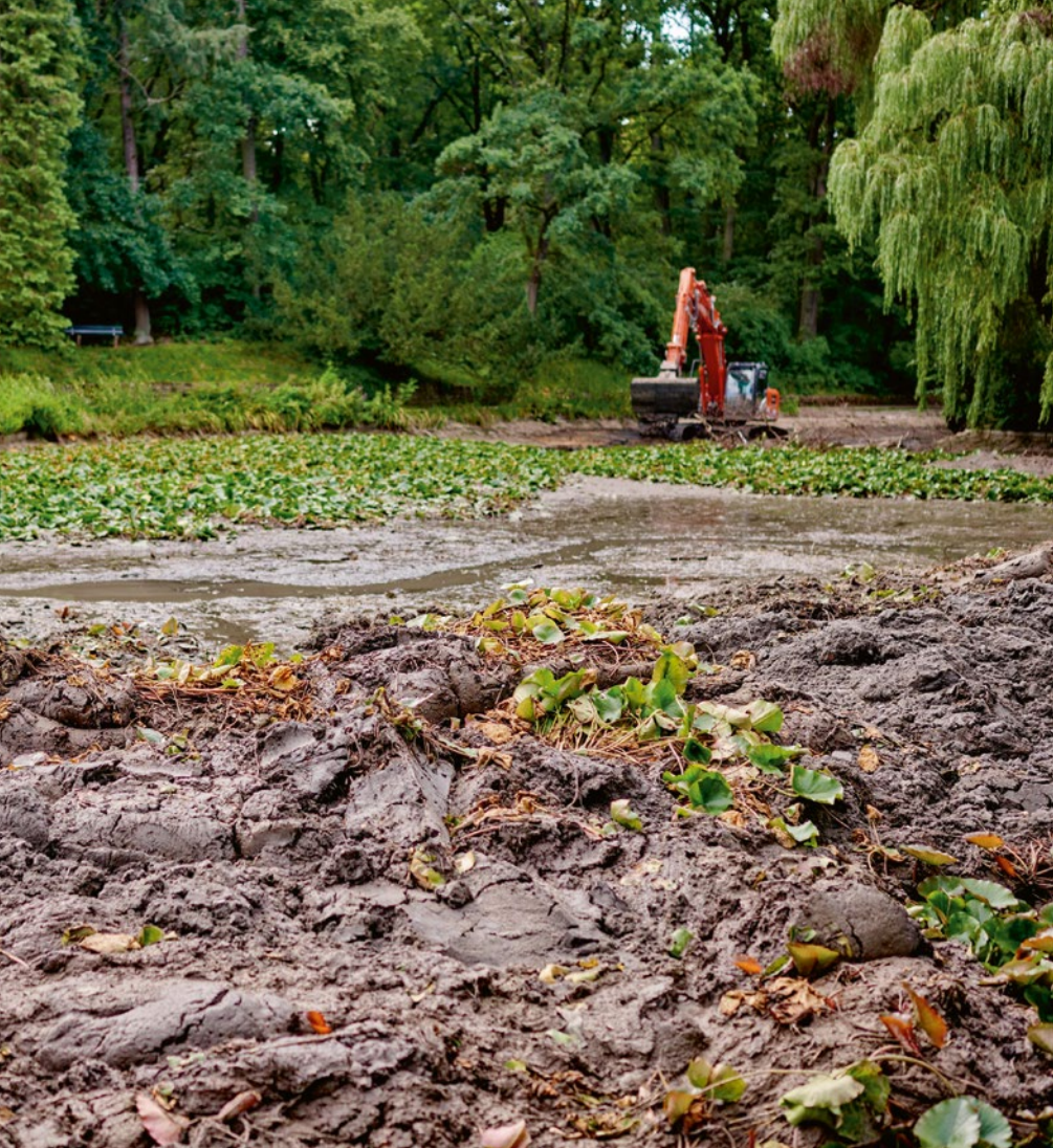
Der Hainweiher drohte zu verlanden, mit Baggern wurde der Schlamm abgetragen (siehe Foto) und der Lebensraum für Tiere und Pflanzen deutlich verbessert.

angesammelt, was zu einer immer stärker werdenden Verlandung und einem allmählichen Zuwachsen des Gewässers geführt hat. Die ökologische Struktur verschlechterte sich dadurch zusehends, insbesondere für die im und am Hainweiher lebenden Tiere“, so der Projektleiter. Bamberg Service hat deshalb ein Rettungspaket für den Hainweiher geschnürt.