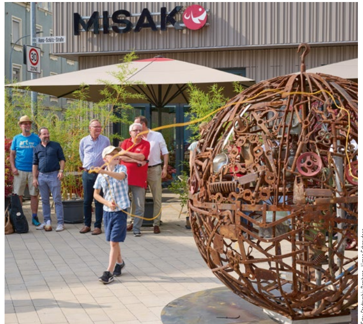
Bei der Wunderburger Kerwa wurde die „Wunderkugel“ der Öffentlichkeit präsentiert.