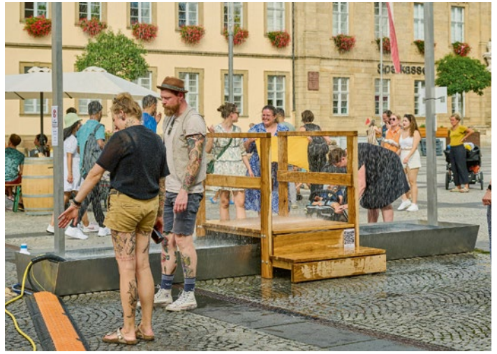
Ein Wasservorhang sorgte im Sommer für Abkühlung.

Vom 18. August bis 3. September liefen testweise auf dem Maxplatz zahlreiche Aktionen, die über das Projekt Mitte Bamberg.2025 gefördert werden: Neben Sitzmöbeln, Hochbeeten und einer Wanderbaumallee gab es hier tagsüber auch einen Wasserspielplatz und einen Wasservorhang zur Abkühlung. Am 19. August wurden zudem beim besten besuchten „Straßenflimmern“ an sechs Orten in der Innenstadt, u.a. am Maxplatz, Kurzfilme mit Bezug zu Bamberg gezeigt.