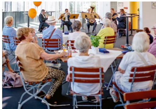
Das Bläserquintett wurde mit der Eröffnung der Konzerthalle im Jahr 1993 gegründet.

Seniosum, probier, Ausbildungsmesse, Studienmesse