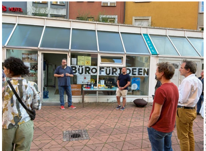
Das „Büro für Ideen“ ist seit September in den Theatergassen.

Im kommenden Jahr wird es die nächste Runde für den Innenstadtfonds geben, bei dem sich wieder Bürger:innen mit Aktionen bewerben können. Der genaue Bewerbungszeitraum wird noch bekannt gegeben.