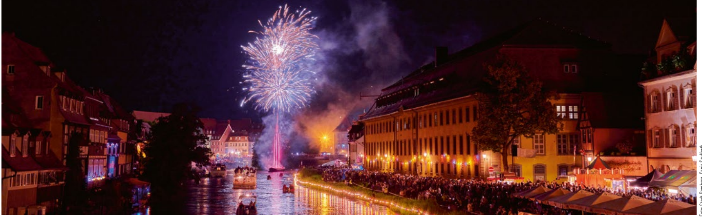
Zum Abschluss der Sandkerwa säumten wieder Tausende die Regnitz, um das traditionelle Feuerwerk zu erleben.