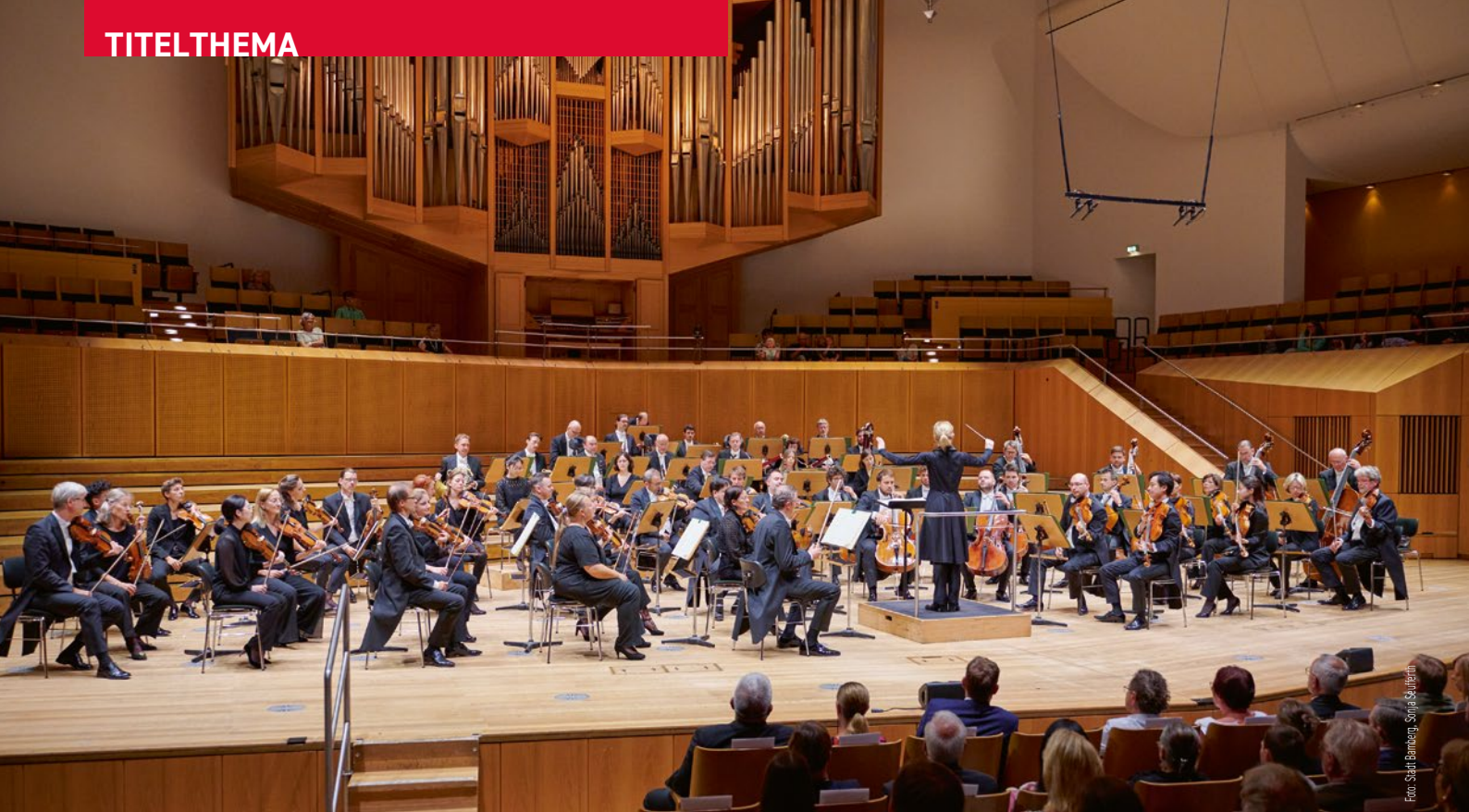
Der Auftritt der Bamberger Symphoniker am Abend bildete den Abschluss und Höhepunkt des Tags der offenen Tür anlässlich des 30. Geburtstags der Konzert- und Kongresshalle.