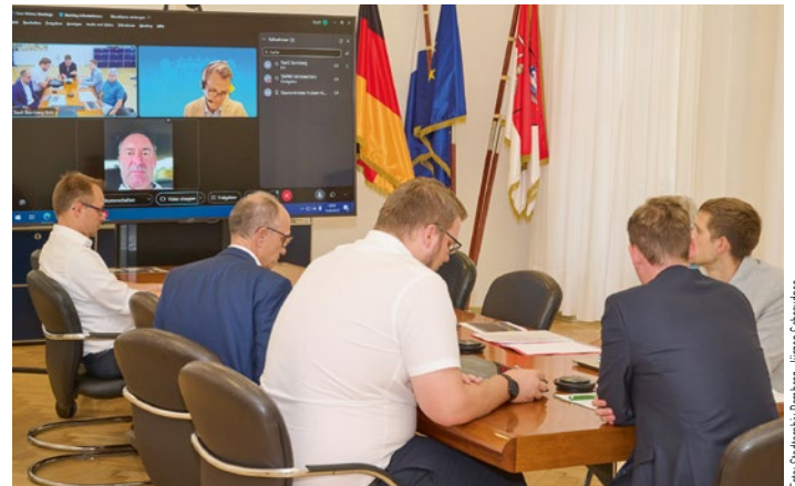
Bei einer digitalen Gesprächsrunde erklärten am Mittwochnachmittag Bamberger Verantwortliche dem Wirtschaftsminister Hubert Aiwanger (Bildschirm) die Bedeutung des Schlachthofs für die Region.