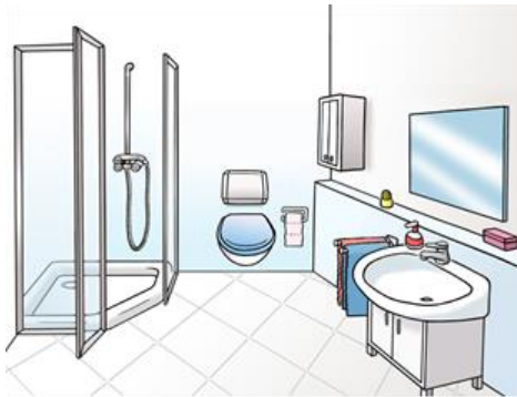
Bade·zimmer mit Hindernissen

Ich berate auch beim Umbau alter Häuser.