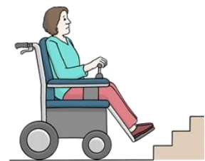
Treppen sind Hindernisse

Zum Beispiel bei der Planung von Gebäuden. Diese Gebäude müssen barriere·frei sein. Barriere bedeutet Hindernis. Ein Hindernis ist zum Beispiel eine Treppe. Für Menschen im Roll·stuhl. Oder für ältere Menschen.