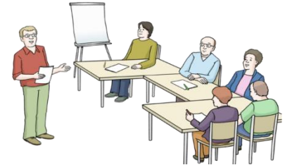
Vortrag bei einem Lehrgang

Kurse oder Vorträge und Informations·abende.