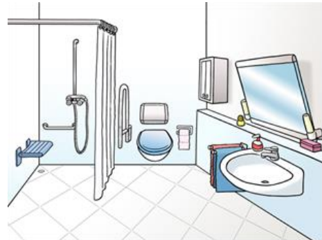
Bade·zimmer ohne Hindernisse