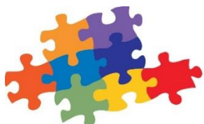
Migrantinnen- und Migrantenbeirat der Stadt Bamberg

Vorsitzende des Migrantinnen- und Migrantenbeirats der Stadt Bamberg